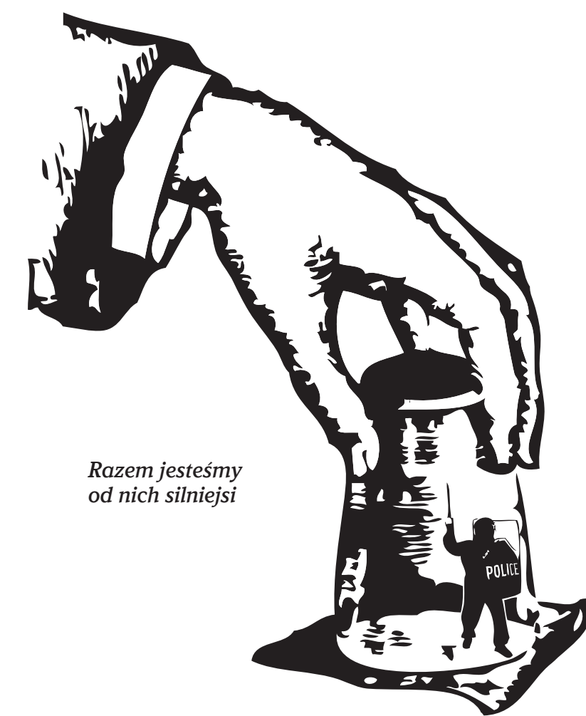
Razem jesteście od nich silniejsi

Takie małe zwycięstwa są szczególnie inspirujące dla tych, którzy regularnie spotykają się z policyjną przemocą. W zbiorowej nieświadomości naszego społeczeństwa, policja jest ostatecznym bastionem rzeczywistości, jest mocą upewnijającą się, że wszędzie pozostaje pod kontrolą. Ścierając się z nimi i wygrywając - choćby na małą skalę - pokazujemy, że rzeczywistość da się zmienić.